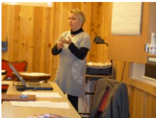
En engasjert/nyankommet rådmann