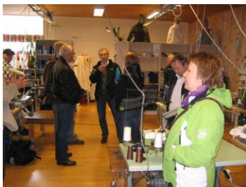
Regionrådet tar seg tid til bedriftsbesøk også. Her fra strikkefabrikken i Hasvik.