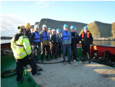
Næringsnettverket og havnesjefer på befaring til "Murmansk"-oppbyggingen utafor Sørvær