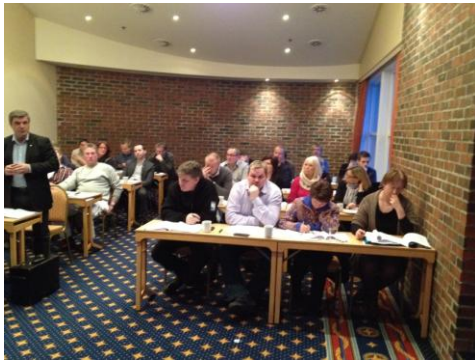
Regiontinget i møte 6. desember 2011

Det 5. ordinære regionting ble avholdt 6. desember 2011 i Hammerfest.