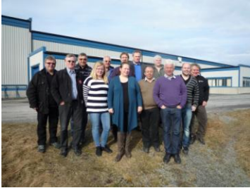
Næringsnettverket og havnesjefer i møte i Havøysund

Næringsnettverket består av næringssejefene og møter jevnlig for å drøfte regionale utfordringer mht næringsutvikling.