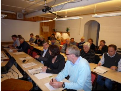
Regionrådet i møte på Skaidi