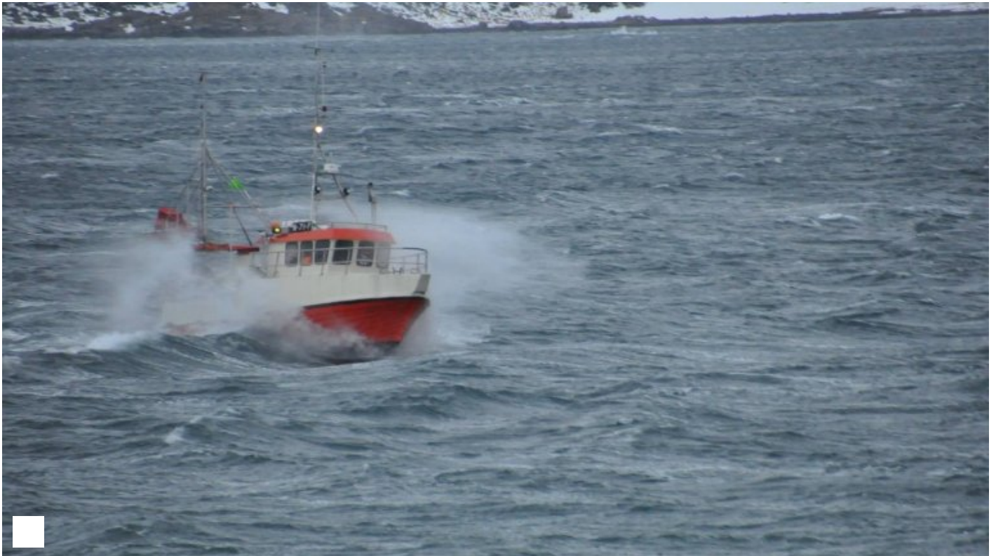
Sjekker sjarkene i Lofoten