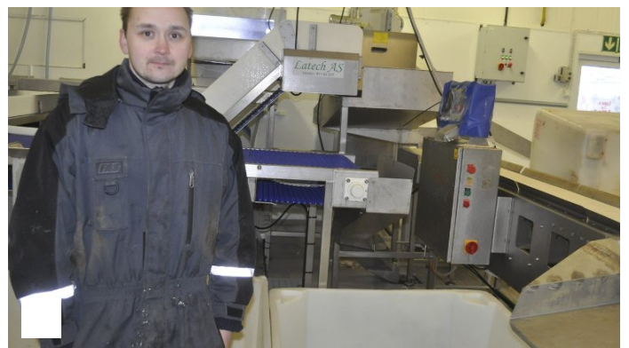
90 mill. til Lofoten: - Hadde håpet på mer i tilskudd